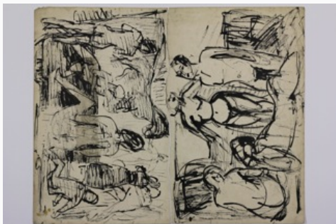
Abb.5: Gr44 und Gr68, VS zusammengesetzt