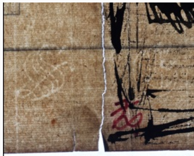
Abb.4: Gr44 und Gr68, VS, Wasserzeichen