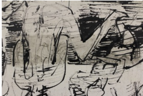
Abb.3: Gr44, VS, Kaltnadel unter der Zeichnung