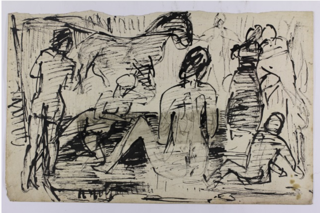
Abb.1: Gr44, VS